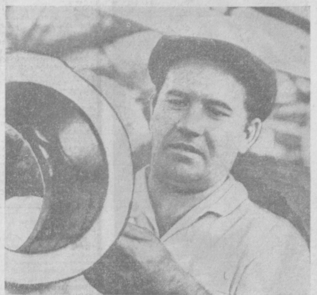
Рассказываем о наставниках

Труженики «Узбексельмаша» за годы девятой пятилетки выпустили около 35 тысяч тракторных хлопковых сеялок, 11,5 тысячи борокочистителей, более 2,5 тысячи механических подборок хлопка.