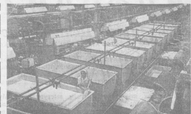
Ташкентский молочный комбинат — одно из молодых предприятий столицы — в короткое время достиг проектной мощности. В первом вышедшем полугодии по основным производственным показателям комбинат вышел на первое место среди родственных предприятий страны. Здесь освоено более 30 видов молочной продукции.