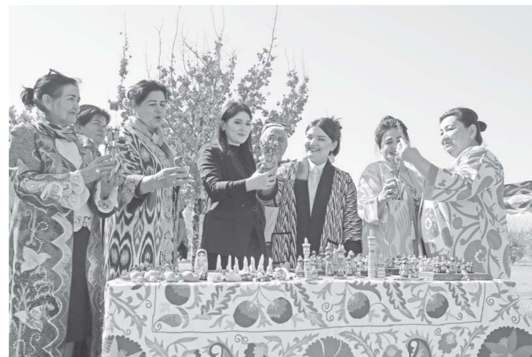
Дар Бухоро тахти шиори «Арзишҳои пайдор бошанд, Наврӯз!» чорабинии ҷашнӣ баргузор шуданд.

Сухбатро БОЛТАЕВА, устои Донишгоҳи давлатии забонҳои хориҷии Самарқанд.