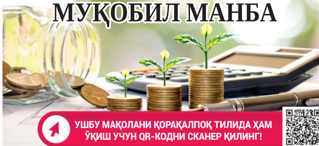
Шаҳноза ХОЛМАҲАМОВА, Олий Мажлис Қонунчилик палатаси депутати

Президентимиз кичик ва ўрта бизнес вакиллари билан учрашувда соҳанинг иқтисодийдаги ўрнини ошириш ва ривожланишини янги босқичга олиб чиқиш масалаларини муҳокама қилди. Учрашувда бизнесни молиялаштиришда муқобил манба сифатида венчур фондларнинг аҳамияти алоҳида таъкидланди ва соҳа учун янги ташаббуслар илгари сурилди.