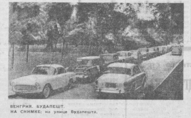
ВЕНГРИЯ. БУДАПЕШТ. НА СНИМКЕ: на улице Будапешта.

БЕИРУТ. В Министерстве здравоохранения Ливана состоялась церемония передачи одного миллиона доз вакцины против полиомиелита.