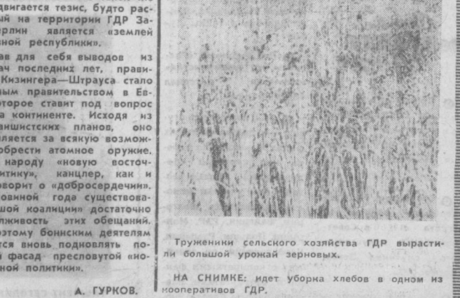
Труженики сельского хозяйства ГДР вырастили большой урожай зерновых. НА СНИМКЕ: идет уборка хлебов в одном из кооперативов ГДР.

НЬЮ-ЙОРК. Около 400 семей эвакуированы из американского города Кенай (штат Аляска). Причина эвакуации — лесной пожар, продолжающийся более недели.