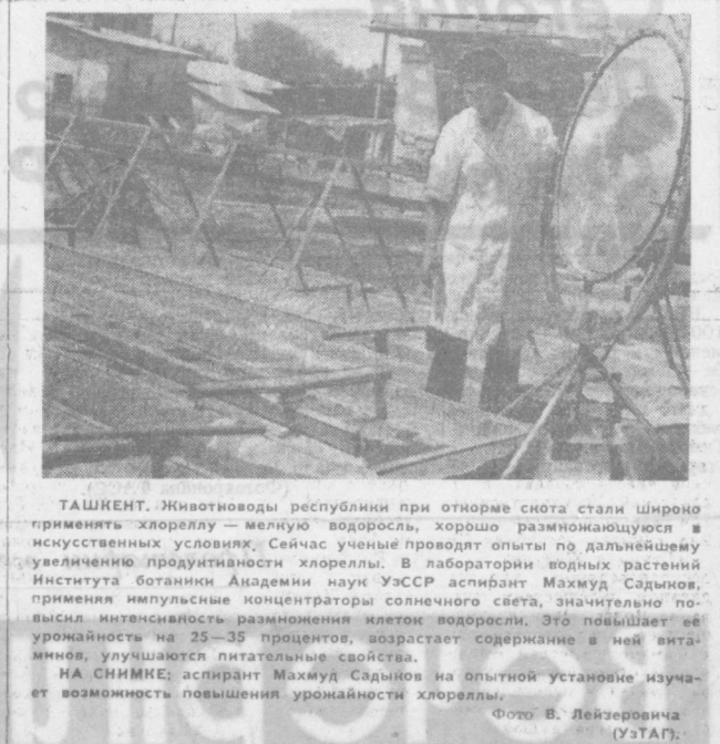
ТАШКЕНТ. Животноводы республики при откорме скота стали широко применять хлореллу — мелкую водоросль, хорошо размножающуюся в искусственных условиях.