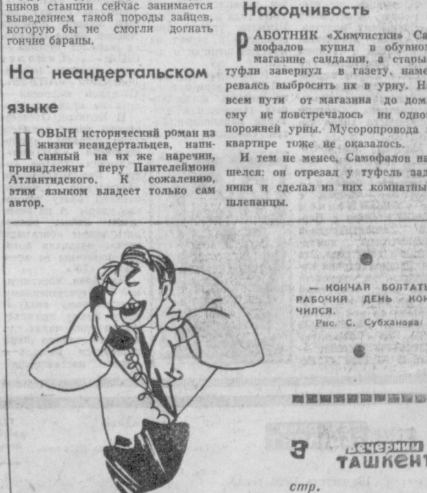
— КОИЧАК БОЛТАТЬ, РАБОЧИЙ ДЕНЬ КОНЧИЛСЯ. РИС. С. СУБХАНОВА.