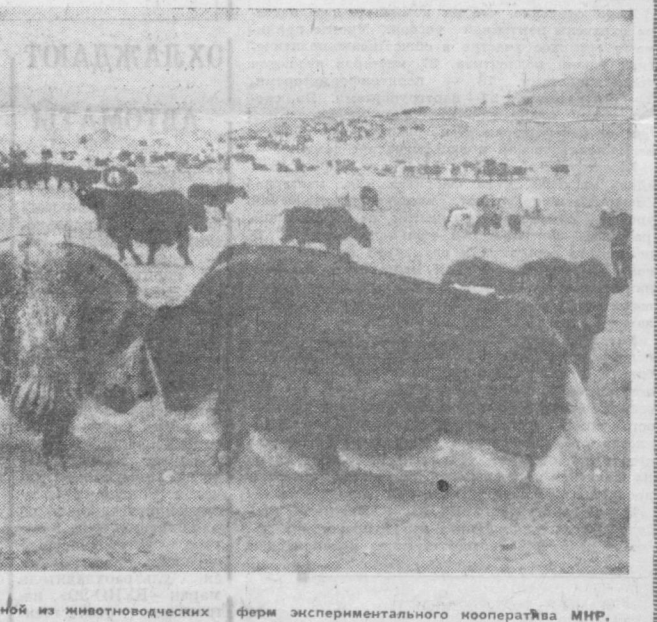
НА СНИМКЕ: в одной из животноводческих ферм экспериментального кооператива МНР.

РИМ. В городе Мон-Аугуста водоизмещением 140 тыс. тонн, судостроительной верфи «Италиантери» танкер из всех, когда-либо построенных на танкерной верфи «Эссо» верфей Италии.