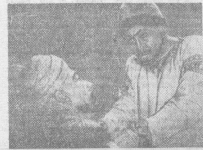
НА СНИМКЕ: кадр из фильма «Алишер Навоий».