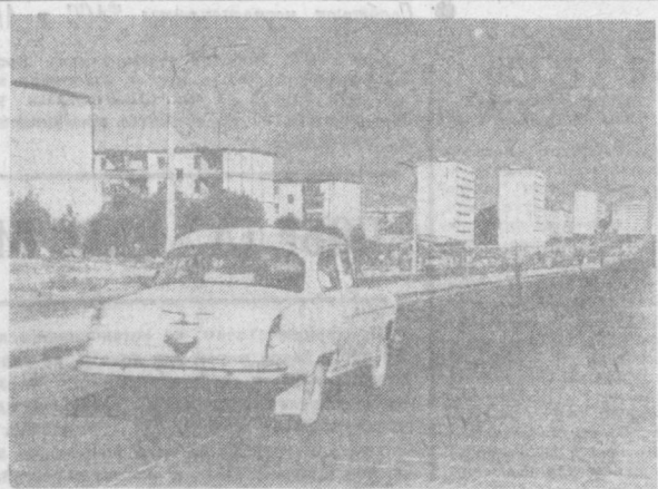
НА СНИМКЕ: одна из новых магистралей столицы — улица Фархадская.

Большие планы по благоустройству Хамзинского района столицы претворяются в жизнь. Весной нынешнего года был разбит сквер на массиве Янгйабд. Здесь посажены кустарники, цветы. Сейчас сносятся дома по улице 2-я Карасу, где вскоре начнется благоустройство набережной, появится зеленый массив, вырастет спортивный комплекс.