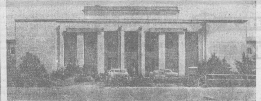
НА СНИМКЕ: здание киностудии «Узбекфильм».