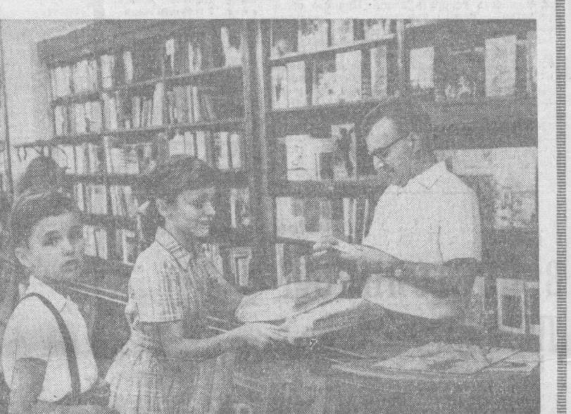
Нанануне нового учебного года в магазинах венгерских городов началась продажа школьных принадлежностей. Для учащихся младших классов — это целый комплект в полиэтиленовой упаковке.

Вот уже неделю пользуется успехом у жителей сирийского портового города Латания художественная выставка «Образ Ленина в изобразительном искусстве». Представленные на ней репродукции картин известных советских художников И. И. Бродского, В. А. Серова, С. В. Герасимова, Н. И. Жукова и других расширяют посетителям многогранную деятельность В. И. Ленина.