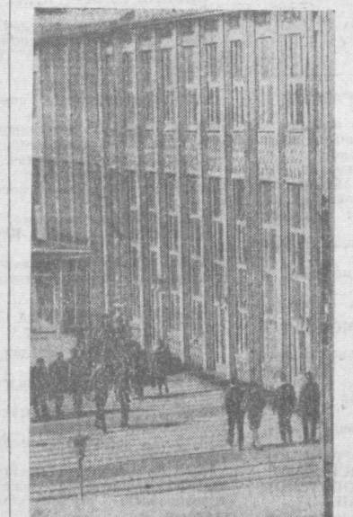
ГДР. ДРЕЗДЕНСКИЙ ПЕДАГОГИЧЕСКИЙ ИНСТИТУТ.

ЗАКОНЧИВАЕТСЯ строительство новых цехов одной из самых известных в Югославии фабрики женской модальной обуви «Ледя» в Книжевоце. После ввода их в строй выпуск обуви увеличится вдвое — 900 тысяч пар до 1.800 тысяч в год. Более половины продукции предприятия идет на экспорт, в том числе в СССР.