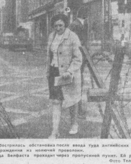
В Северной Ирландии обострилась обстановка после ввода туда английских войск. На улицах Белфаста установлены заграждения из игольчатых проволоки. НА СНИМКЕ: жителяница Белфаста проходит через пропускной пункт. Ей разрешено посетить ближайший магазин.

ДЕЛИ. Выступая на массовом митинге служащих банков и газет, премьер-министр Индии Индира Ганди, как сообщало агентство ИТА, заявила, что национализация банков в стране вызвала у народа огромный энтузиазм. «Однако, — заявила она, — есть некоторые люди в партии Индийских национальных конгресс, не желающие прислушаться к голосу миллионов». Индира Ганди призвала еще упорнее трудиться над тем, чтобы быстрее осуществить намеченные правительством социально-экономические мероприятия.