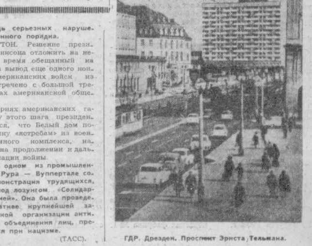
ГДР. Дрезден. Проспект Эрнста Тельмана.

Сегодня в Ташкенте — небольшая облачность без осадков. Ветер слабый. Температура 35-37 градусов.