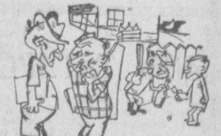
— Как видите, стором у нас всю ночь на ногах!