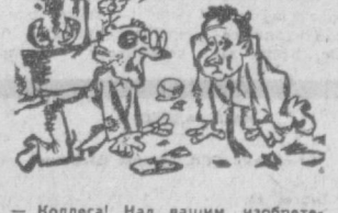
— Коллеги! Над вашим изобретением надо еще поработать...