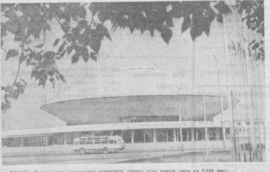
КАЗАНЬ. Украшением старинного волжского города стал новый цирк на 2350 мест.

соревнованиях такого масштаба узбекским спортсменам сопутствовал столь большой успех — наши команды завоевали треть призовое место и почетный диплом. Лучшей среди борды в гребле заняли третье место, в плавании и парусных гонках они были четвертыми, в стрельбе — пятыми и кросс принесли им седьмое место.