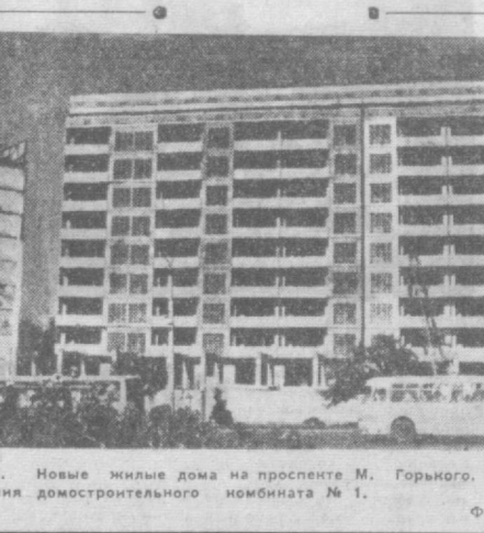
ТАШКЕНТ СЕГОДНЯ. Новые жилые дома на проспекте М. Горького. Их возводит строителям монтажного управления домостроительного комбината № 1.

Питаться всеядно человек одновременно может в новой трехэтажной столовой завода электронной техники, строительство которой ведет коллектив переработчиков механической заводской № 18 спейстреста № 4 Министерства строительства республики. Проект этого оригинального здания создан ереванскими архитекторами. Железобетонные конструкции остова, стальные пролеты, светлый мрамор фасада — все это придает зданию нарядный, праздничный вид. Новая столовая украсит перекресток улиц «Правды Востока» и Приаичинцова.