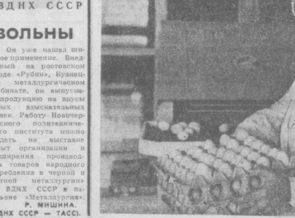
ВДНХ СССР — ТАСС.

НА СНИМКАХ: новые автоматизированные птичники, изготовленные специалистами Венгерской Народной Республики; у аппарата по сбору яиц. Фото И. Ключева. (АПИ).