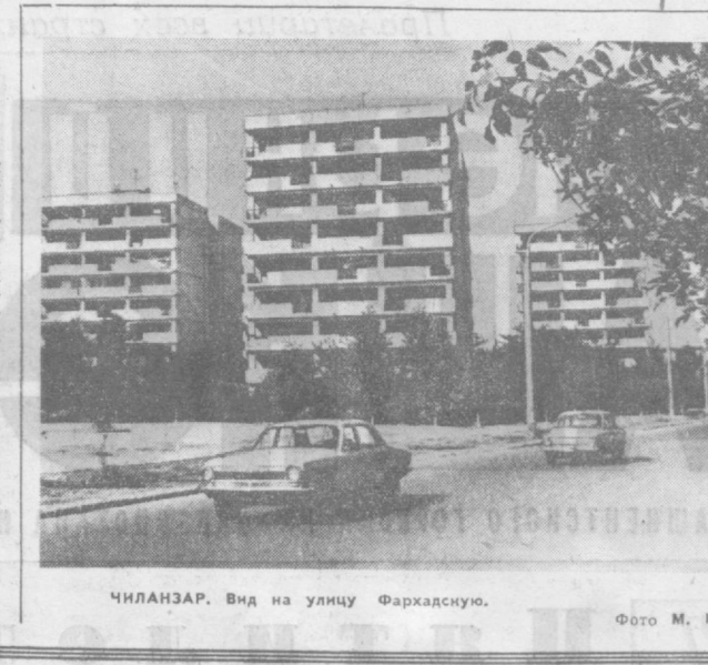
ЧИЛАНЗАР. Вид на улицу Фархадскую.

внимание техническому перевооружению производства. Так, недавно в строй действующих вступил конвейер по подаче молока со склада в цехи. С его пуском намного увеличится операция по доставке исходного сырья. Коллектив молочного комбината завершил о досрочном выполнении пятилетнего плана по объему производства, росту производительности труда. Встав на ударную трудовую вахту в честь XXV съезда КПСС, труженники комбината выпускают сверхплана 21.400 тонн молочной продукции.