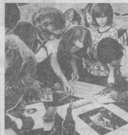
ОРХУС. Выставка советской книги открылась в Доме студентов в датском городе Орхусе.

Средства, поступившие от воскресника, более 140 тысяч рублей, будут направлены на строительство полиграфической базы издательства «Еш гвардия».