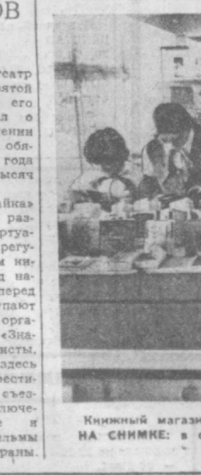
Книжный магазин № 23 — один из лучших в Чиланзаре. НА СНИМКЕ: в отделе изобразительного искусства. Фото М. Нуритдинова.

НА СНИМКЕ: в отделе изобразительного искусства. Фото М. Нуритдинова.