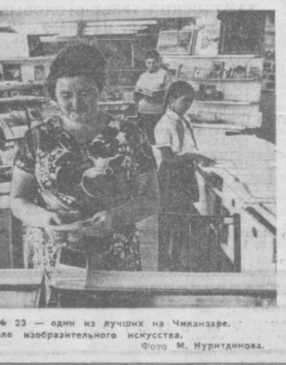
Книжный магазин № 23 — один из лучших в Чиланзаре. НА СНИМКЕ: в отделе изобразительного искусства.