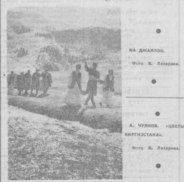
НА ДЖАЙЛОО.