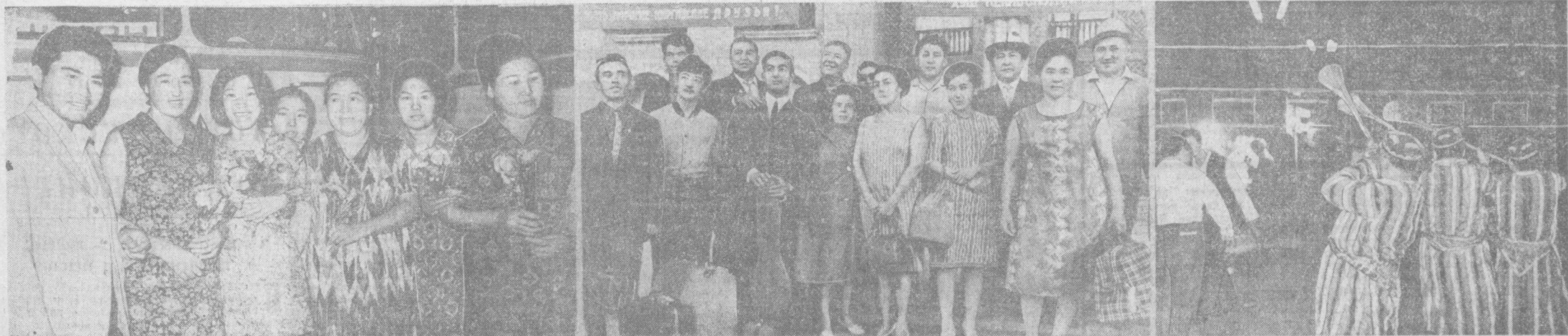
СЕРДЕЧНАЯ ВСТРЕЧА НА УЗБЕКСКОЙ ЗЕМЛЕ.