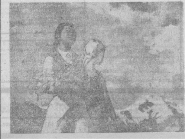
А. ЧУЯКОВ. «ЦВЕТЫ КИРГИЗСТАНА».