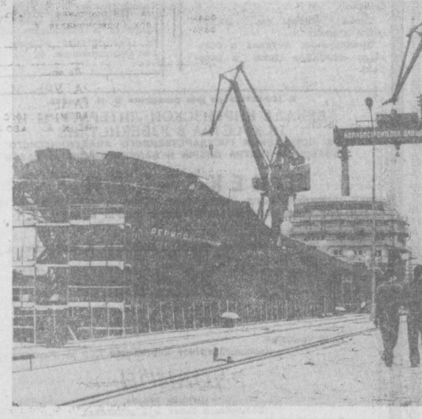
За годы народной власти в Болгарии создано современное судостроение. В 1968 году построены суда общим водоизмещением 130 тысяч тонн. К 1975 году предусматривается увеличить выпуск судов по сравнению с 1968 годом в три раза.

НА СНИМКЕ: строительство углевода «Вирла» водоизмещением 10 тысяч тонн на Верненском судостроительном заводе имени Георгия Димитрова.