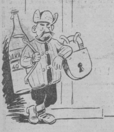
ВО ВСЕОУЖИИ... Рис. М. Воробейчикова.