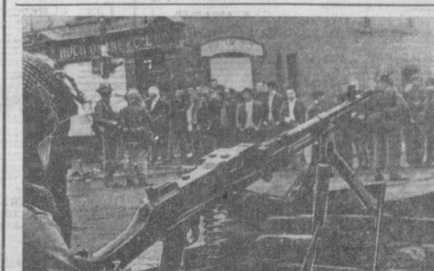
Население Северной Ирландии, несмотря на вторжение английских оккупационных войск в страну и полицейские репрессии, продолжает борьбу за превращение полуколониального статуса страны, за демократические права.

В газетных киосках появились новые информационно-публицистические еженедельники «Перспективы». На сорока красочно иллюстрированных страницах первого номера публикуются ряд статей и материалов по вопросам общественно-политической жизни в стране и за рубежом. Читатели ознакомятся в журнале с биографиями видных политических деятелей, а также прочтут интересные документальные материалы и исторические справки. Культура, политика, история Польши, экономика, спорт — вот только некоторые из рубрик журнала, который заинтересует как польских, так и зарубежных читателей.