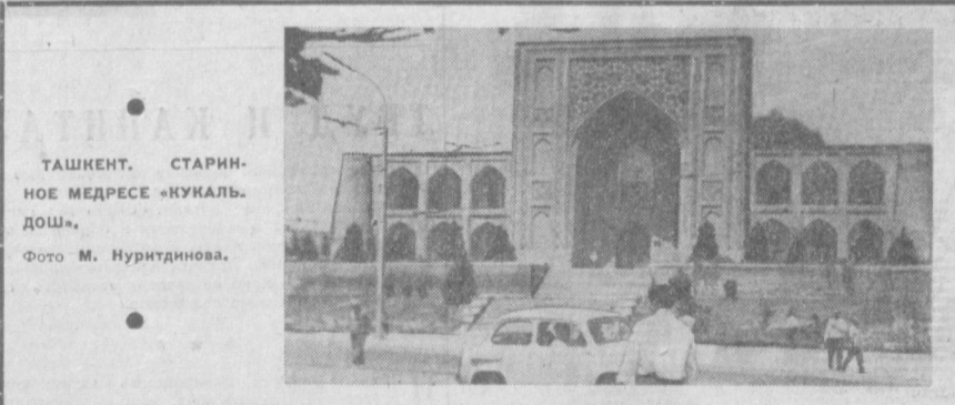
ТАШКЕНТ. СТАРИННОЕ МЕДРЕСЕ «КУКАЛЬДОШ».

лее семидесяти деревьев. Осенью любитель-садовод заложит здесь розарий, разобьет клумбы. Сад — скромный подарок рабочего-строителя ко дню рождения В. И. Ленина.