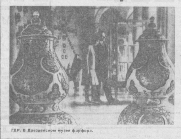
ГДР. В Дрезденском музее фарфора.