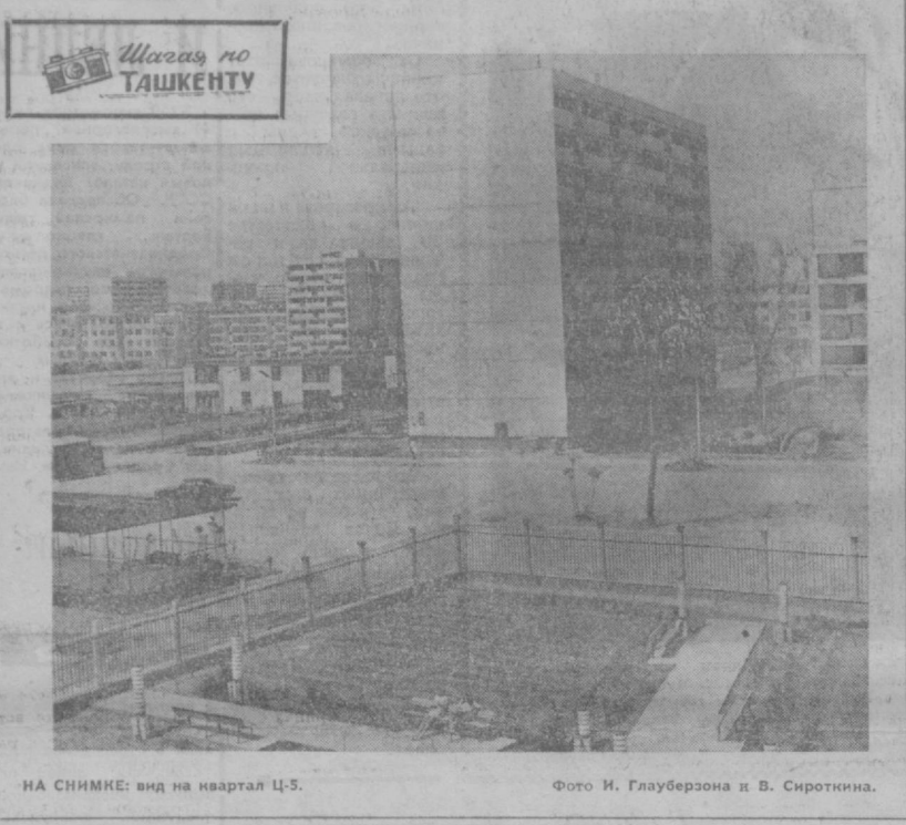
НА СНИМКЕ: вид на квартал Ц-5.