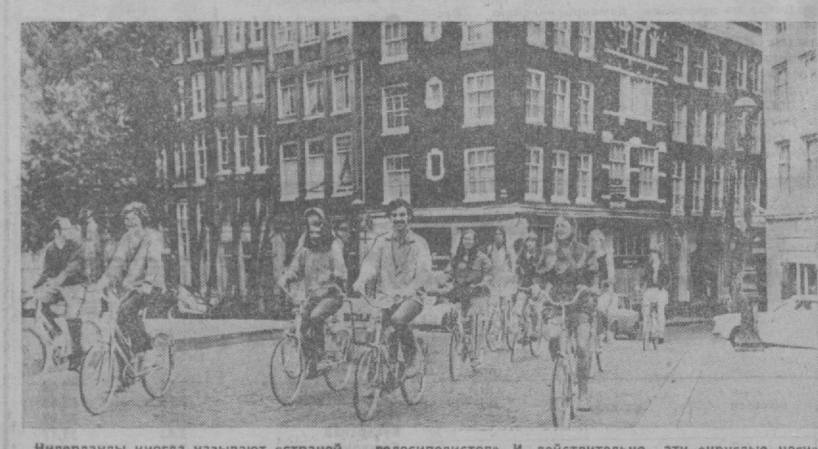
Нидерланды иногда называют «страной велосипедистов». И действительно, эти «крутые ноги», как их называют голландцы, — средство передвижения для всех. На велосипеде ездят на работу, в магазин, в гости... В стране насчитывается 40 велосипедных заводов, производящих ежегодно около 550.000 обычных и 150.000 моторизованных машин. По количеству велосипедов на душу населения Голландия занимает первое место в мире. НА СНИМКЕ: на улицах Амстердама.

Натан обратился к властям с просьбой разрешить ему выехать в Индию, однако получил категорический отказ. И вот в одну из августовских ночей он нелегально перешел на территорию Ливана, где и был задержан местной погранохраной. При аресте он заявил пограничникам, что покинул Израиль, чтобы просить содействия индийского посольства в Ливане в репатриации на свою родину — в Индию. «На днях в Дели проходил симпозиум «Обращение друзей Израиля», которое преследует цель оказывать научим