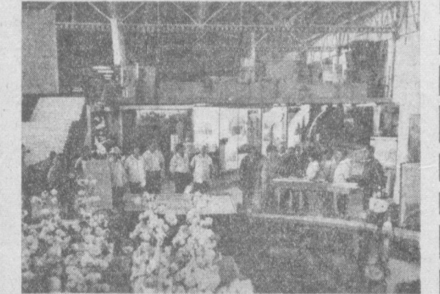
НА СНИМКЕ: участники декады на ВДНХ УССР.

Сегодня вечером участники декады побывали в Фергане, молодом городе химиков Навои, Самарканде, колхозах. В концертах примут участие заслуженные артисты Киргизии Л. Ярош и М. Темирбеков, ансамбль народного гаянца под руководством заслуженного деятеля искусств Киргизии С. С. Токтоналиев, А. Джумабаев, М.