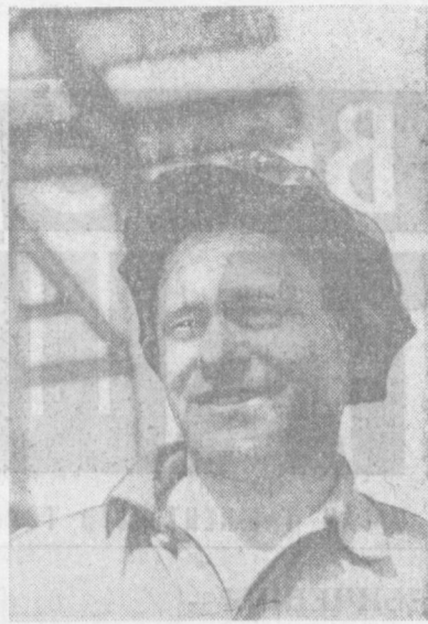
Строительное управление № 69 — одно из лучших в тресте «Высотстрой» № 11. Его коллектив возвел в Ташкенте десятки жилых домов, культурно-бытовых учреждений.

Заводской радиоузел стал активным помощником партийной организации предприятия в работе по коммунистическому воспитанию.