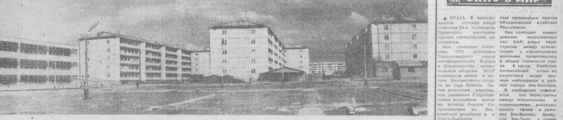
ТАШКЕНТ СЕГОДНЯ. Жилые дома на массиве Каранамыш, воздвигнутые строителями города. Навон в дар Ташкенту.

выехал по Ташкенту. Красочно оформленная машина — кинопередвижка предназначена специально для показа детских и мультипликационных фильмов. Зал «Малютки» вмещает 30 зрителей. В миниатюрном кинотеатре свои порядки. Ребята выполняют обязанности контролера, администратора, даже... директора.