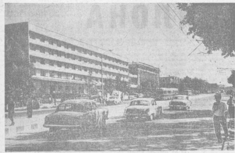
ТАШКЕНТ СЕГОДНЯ. НА СНИМКЕ: ВИД НА УЛИЦУ НАВОН. Фото А. Палехова.

АДОБЛАЧНЫЙ газовый слой на Юпитере очень тонкий или отсутствует совсем. Это удалось доказать астроному В. Абрамчуку из Главной астрономической обсерватории Академии наук Украины. Успеху способствовало мощное оборудование и применение современных математических методов обработки материалов. В результате получены новые данные о структуре верхней атмосферы планеты. Они свидетельствуют о том, что надоблачный слой не может существовать в виде самостоятельного образования на поверхности планеты. Данные спектрального анализа говорят о том, что содержание метана в атмосфере Юпитера в 8-10 раз меньше, чем было вычислено американскими учеными. Значительно меньше в ней и аммиака. Параллельно велось изучение ближайшего родственника Юпитера в семействе планет-гигантов — Сатурна. Оказалось, что на Сатурне надоблачный слой существует. О. ПОПОВА. (Корр. ТАСС). Киев.