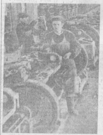
Горячая пора в эти дни на Ташкентском ремонтно-механическом заводе — ремонтируется сельскохозяйственная техника для труженников полей. НА СНИМКЕ: ремонт двигателей гусеничных тракторов в моторном цехе.

их получено 12 тысяч штук. В этом году на дашархан ташкентцев поступит 3 миллиона 140 тысяч яиц.