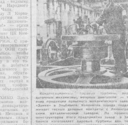
Конденсационные паровые турбины, передаточные механизмы, мощные двигатели — таковы продукция польского механического завода «Замех» в Эльблонге. Коллектив завода поддерживает тесные деловые контакты с Ленинградским металлургическим заводом. По проектам строителей этого предприятия завод в Эльблонге изготавливает паровые турбины для тепловых электростанций, которые поступают на энергетические объекты Польши и Советского Союза. НА СНИМКЕ: в цехе завода «Замех».

ВАРШАВА. Полиция Варшавы провела массовую облаву на одном из крупнейших рынков города. Эта мера была предпринята в соответствии с правительственной программой искоренения контрабанды товаров в Польшу. Согласно опубликованным данным, во время рейда полиция и служба внутренней безопасности обнаружили и изъяли больше партии золота, промышленных изделий, продовольствия, наркотиков и другие новейшие электронные образцы на сумму свыше 100 тыс. американских долларов. Произведен арест. Местная печать пригласила милицию и представителей власти по ликвидации контрабанды, которая причиняет значительный ущерб экономике государства.