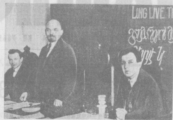
В. И. Ленин в праздничном Конгрессе Коминтерна в Кремле. Москва, 2—6 марта 1919 года. Слева, направо — Г. Эберлейн, В. И. Ленин и Ф. Платтен. (Фотохроника ТАСС).