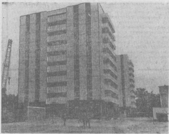
ТАШКЕНТ СЕГОДНЯ. Новые жилые дома, возведенные московскими строителями в квартале Ц-1.

Новый коллектив познакомит зрителей с современными южнокорейскими песнями и танцами, а также с некоторыми традиционными видами национального искусства. Аф. КИМ.