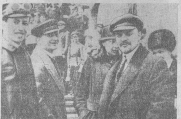
В. И. Ленин и комиссар по военным делам Венгерской Советской Республики Тибор Самуэля (крайний слева) в Москве в мае 1919 года. (Фото ТАСС).

Премьер-министр Йеменской Республики Хасан аль-Арун. 1 октября 1968 г. (АПН).