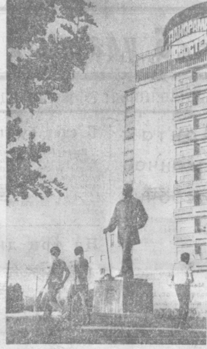
ТАШКЕНТ СЕГОДНЯ. У памятника М. Горькому.