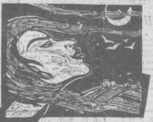
Г. Чиганов. Иллюстрация к книге Э. Межелайтиса «Человек». Линогравюра.

легенд и преданий до дитя и чеченца, душевное благородство и быт — неотделимы. Философски-обобщенное восприятие мира, сложная, разветвленная символика, метафорическая глубина, многомерность и мощь, нравственно-эмоциональная насыщенность образов, характерные для поэзии Э. Межелайтиса, выразительно переданы Чигановым в серии линогравюр к поэме литовского поэта «Человек». Говоря словами поэта, произведения Г. Чиганова словно несут нам в своих красках, то переливчато-нежных, струящихся, певучих, то насыщенных и сонных, — «музыку Вселенной», которая из века в век преобладает чистой и нетленной, чтобы радовался Человек». Г. ЛЕОНИДОВ.