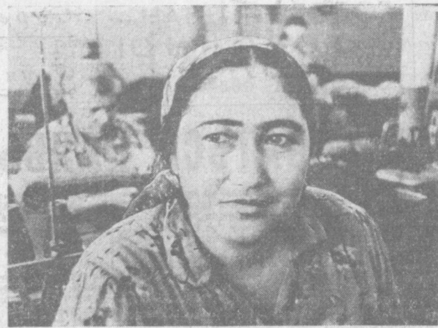
Как и ее подруги по работе, Нарбуян готовится к достойной встрече XXV съезда партии.

ОРГАН ТАШКЕНТСКОГО ГОРКОМА КП УЗБЕКИСТАНА И ТАШГОРСОВЕТА