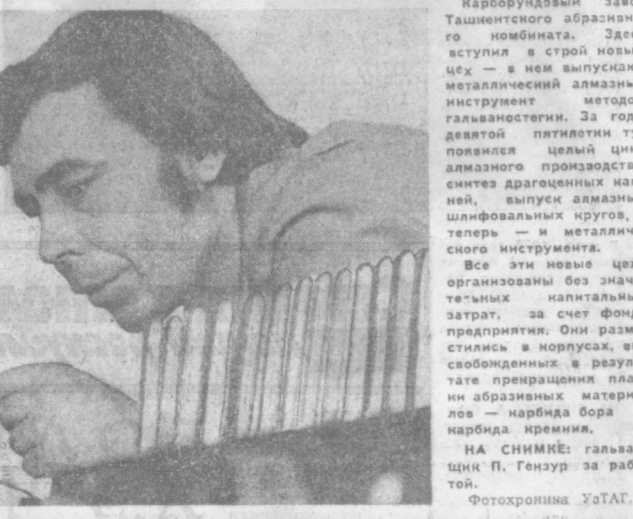
Карборундовый завод Ташкентского абразивного комбината. Здесь вступила в строй новая цех — в нем выпускают металлический абразивный инструмент методом гальваностегии. За годы девятой пятилетки тут появился целый цинк алмазного производства: синтез драгоценных камней, выпуск алмазных шлифовальных кругов, алмазных инструментов.

Успешно завершено строительство первой очереди Рязанской ГРЭС мощностью 1 миллион 200 тысяч киловатт и дорочно выполнены задания по выработке электрической энергии.