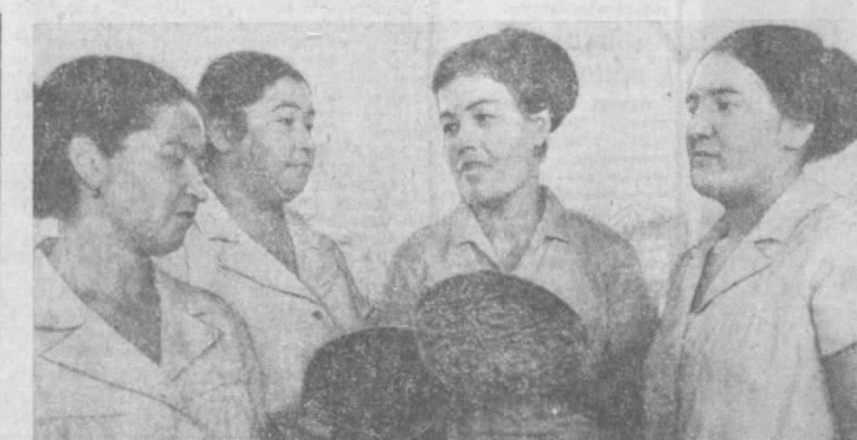
Труженники фабрики головных уборов имени Ахунбаева досрочно выполнили план десяти месяцев. Только за девять месяцев завершающего года пятилетки дополнительно выдано продукции на 578 тысяч рублей.

Механизаторы приняли социалистическое обязательство — до конца года выполнить сверх плана строительного-монтажных работ на 600 тысяч рублей.