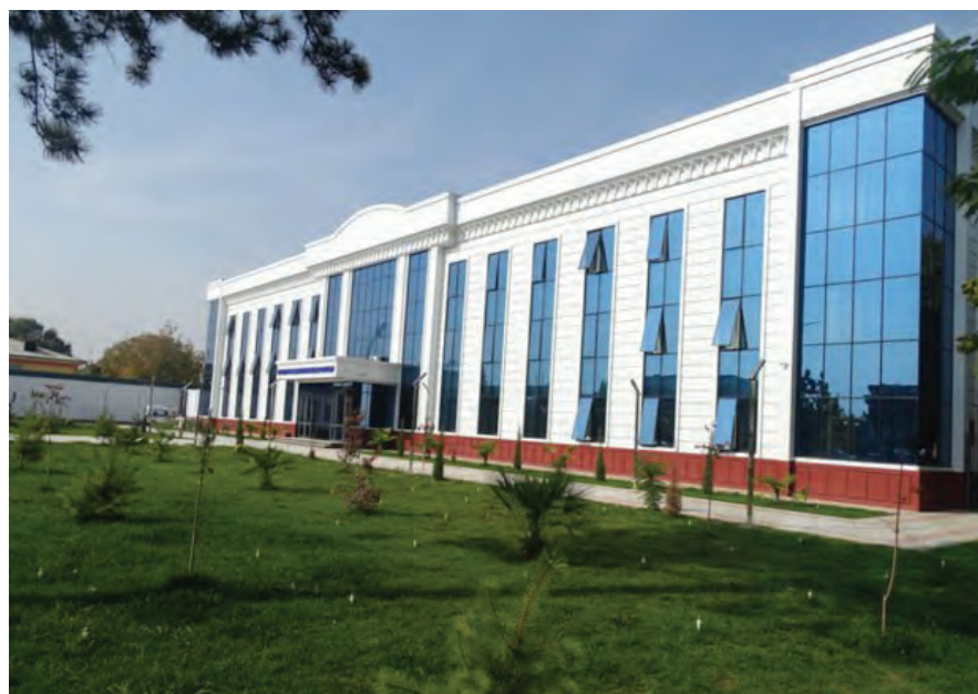
Namangan viloyati Uychi tumani IIB binosining avvalgi va hozirgi ko'rinishi.