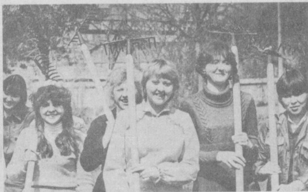
НА СНИМКЕ: ташкентцы на хашаре.