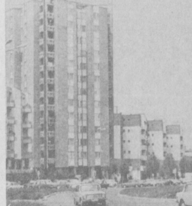
НА СНИМКЕ: вид города-побратима Снопье.

На Юнусабадском колхозном рынке: сверху — на этой ярмарке представлена продукция хозяйства Бухарской области.