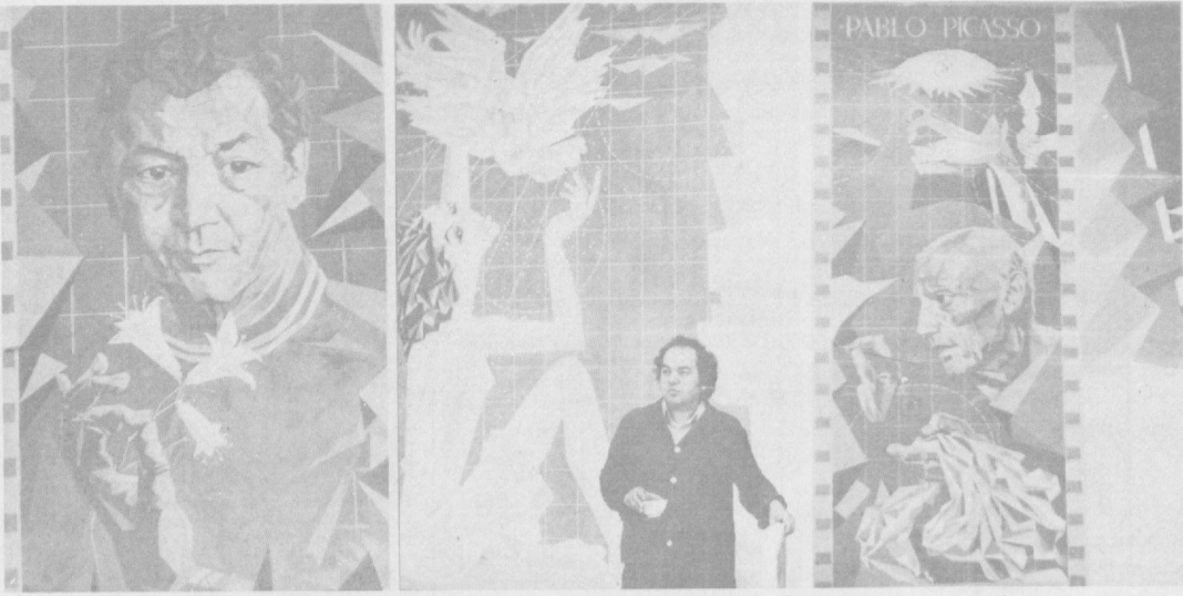
«Искусство в борьбе за мир» — роспись интерьера Дома кино, посвященная 60-летию Узбекской ССР и Компартии республики.