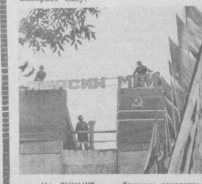
НА СНИМКЕ: Ташкент готовится к Первомаю.

Коллектив трикотажного производственного объединения «Малика» выпустил с начала года 50 тысяч штук изделий белого и верхнего трикотажа на сумму один миллион рублей. Ударная вахта трикотажников в честь Первомай набирает силу.