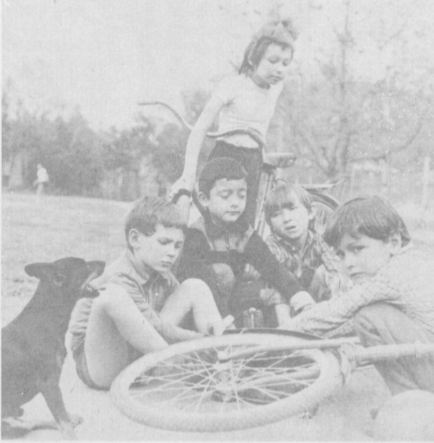
ИЗ СЕРИИ «МЫ И НАШИ ДЕТИ»