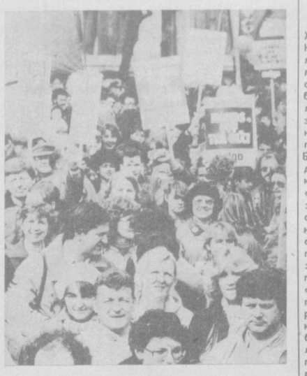
«Нет! — сокращению ассигнований на нужды города!» «Руки прочь от муниципалитетов!» — под таким лозунгом в Лондоне состоялась массовая демонстрация против решения кабинета торжественно утвердить Совет Большого Лондона — крупнейшую административную единицу Западной Европы — и муниципалитеты шести других крупнейших городов. В колоннах марша протеста, проведенного по инициативе Британского конгресса тред-юнионов, шли десятки тысяч людей.