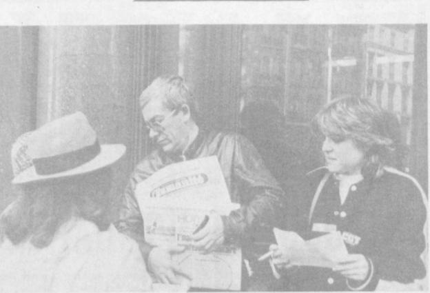
Свое 80-летие отмечает газета «Юманите» — центральный печатный орган Французской коммунистической партии. Она была основана в 1904 году страстным борцом против войны и колониализма Жаком Жоресом. В 1920 году, когда во Франции была создана Коммунистическая партия, «Юманите» стала первой ежедневной коммунистической газетой страны.