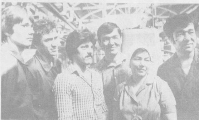
В Куйбышевском районе коллектив тракторного завода — один из передовых, в Хамзинском — завод «Подъемник». Машиностроители соревнующихся районов успешно выполняют государственные планы и социалистические обязательства, принятые на 1984 год, в ознаменование 50-летия республики и Компартии Узбекистана.

Желает много лучшего состояние трудовой и технологической дисциплины.