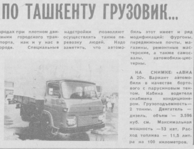
НА СНИМКЕ: «АВИА А 20». Вариант автомобиля в качестве бортового с парусиновым тентом. Кабина водителя снабжена кондиционером. Грузоподъемность — 2 тонны. Двигатель — дизель, объем — 3.596 куб. см. Максимальная мощность — 53 квт. Расход топлива — 11,5 литра на 100 километров.

Вот что пишет в редакцию наш постоянный читатель — слесарь Ташкентского опытного ремонтно-механического завода Д. Ключков: «В последнее время на улицах Ташкента можно увидеть большое количество синих грузовых автомобилей с оранжевым тентом. Конструкция их не знакома не только мне, но и многим другим автомобилистам. Прошу рассказать об этом автомобиле на страницах «Вечернего Ташкента». Выполняем эту просьбу. Грузовой автомобиль «АВИА А 20» выпускается в Чехословакии на национальном предприятии «АВИА Прага-Летяны». Предприятие это является широко известным изготовителем грузовых автомобилей малой грузоподъемности, успешно применяемых в различных областях народного хозяйства. Своей подвижностью, малыми габаритами, экономичностью, современным внешним видом эти автомобили представляют собой почти идеальное транспортное средство для перевозки товаров и материалов в городах при плотном движении городского транспорта, как и в населенных пунктах. Специальные надстройки позволяют осуществлять также перевозку людей. Надо заметить, что автомобиль «АВИА А 20» — вариант автомобиля в качестве бортового с парусиновым тентом. Кабина водителя снабжена кондиционером. Грузоподъемность — 2 тонны. Двигатель — дизель, объем — 3.596 куб. см. Максимальная мощность — 53 квт. Расход топлива — 11,5 литра на 100 километров.