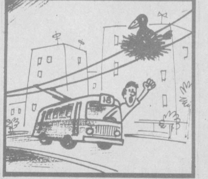
Рис. С. Златина.

За последнее время участились неполадки на троллейбусном маршруте № 18. Например, 23 мая на остановке «Урда» мы остановились в 19.00 до 19.40. Один из нас поинтересовался у водителя 8-го маршрута, в чем причина задержки. — Обед, машины стоят на конечной остановке «Вузгородки», — последовал ответ. Через 10 минут подъехал 18-й трол-