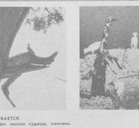
Объектив улыбається. Причуды природи: лесное чудиче, пингвин.

тори. Много интересного и полезного рассказал писатель собравшимся, познакомившись с новыми творческими работами, стихотворными произведениями, переводами на русский язык узбекских поэтов. «Машинистроитель».