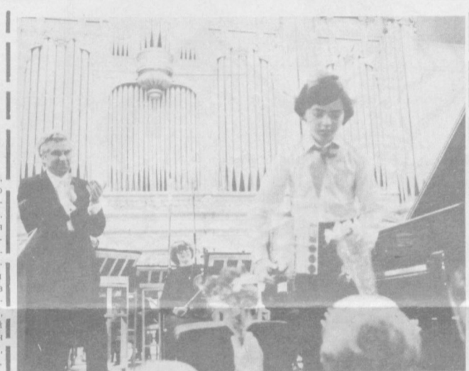
Музыканты в возрасте 12 лет.

Необычайно красочно, по-весеннему оживленно в эти дни в Центральном выставочном зале. Здесь заканчивается подготовка новой большой отчетной экспозиции ленинградских художников. «Отстоим мир» — таков девиз выставки, которая открывается здесь с 10-го мая. Выставка, собранная более полутысячи произведений живописи, графики, скульптуры, декоративно-прикладного и театрально-декорационного искусства. Тема борьбы за мир всегда занимала важное место в творчестве ленинградских мастеров кисти и резца. В этом году они решили посвятить отдельную выставку.