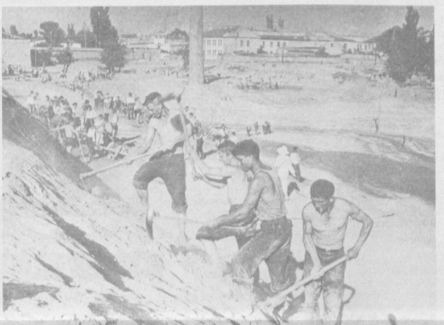
НА СНИМКАХ: на строительстве озера в парке имени Ленинского комсомола (1936 г.); озеро в парке сегодня.