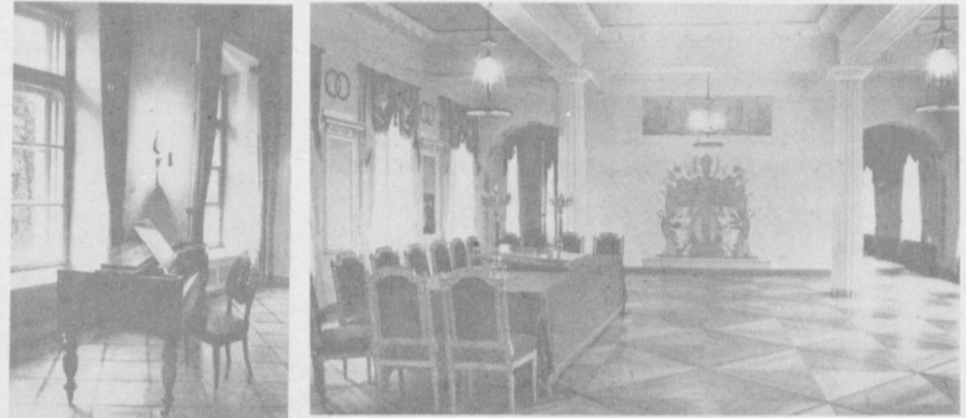
НА СНИМКАХ: в лице — класс пенки; большой зал.