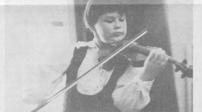
Скрипка Страдивари — у юного сибиряка

ОТЧАЯНИЕ и боль, призыв о помощи и в то же время неуверенность в том, что все может измениться к лучшему, звучат в письме, присланном в редакцию: «Большой радостью для нас стало появление в семье сначала сына, потом дочери. Мы с мужем делили все для того, чтобы у ребенка не сходил с ума. Но неожиданно умер муж. Я осталась с детьми одна, и мне было нелегко воспитывать их. Но когда они подросли, стало еще хуже. Сын рос добрым и трудолюбивым. А вот дочь стала проявлять свой строптивый характер уже в школе. Учился плохо, только по физкультуре была четверка. Главными учителями, тетрадями, учебниками, тетрадями, губками. Вынуждена была устроить ее в детдом. Через три дня она оттуда сбегала. Я обратилась в пионерскую организацию за помощью, потом — в детскую комнату милиции. Но ничего не помогало. В школе она дралась. Начала красть деньги, покупать косметические принадлежности, бегать на танцы. Директор школы предлагала мне устроить ее в детдом, но я еще надеялась на лучшее. Но это лучше не пришло. Теперь появилась дурная компания. Бегает по кафе и ресторанам, выпивает, угрожает мне». Мать не может повлиять на дочь? Когда и как кончилось это влияние? Что привело к обострению отношений между ними? Слу-