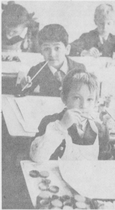
Школа № 146 Таш-различных навыков у детей. Здесь есть все условия для развития НА СНИМКАХ: