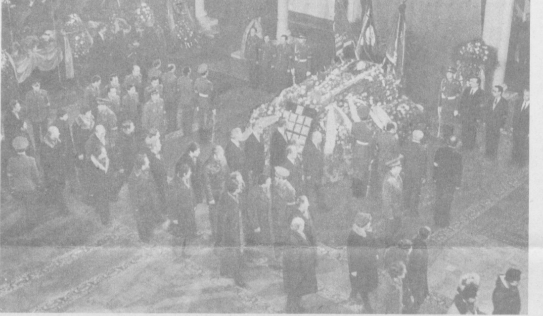
В Колонном зале Дома союзов.