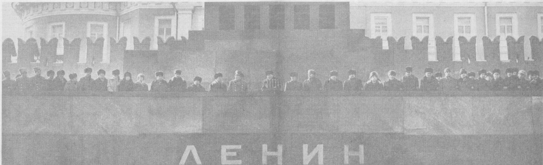
Москва, 14 февраля 1984 года. На трибуне Мавзолея В. И. Ленина.

Вчера советский народ, все прогрессивное человечество проводили в последний путь выдающегося деятеля Коммунистической партии и Советского государства, пламенного патриота социалистической Родины, неутомимого борца за мир и коммунизм Юрия Владимировича АНДРОПОВА.