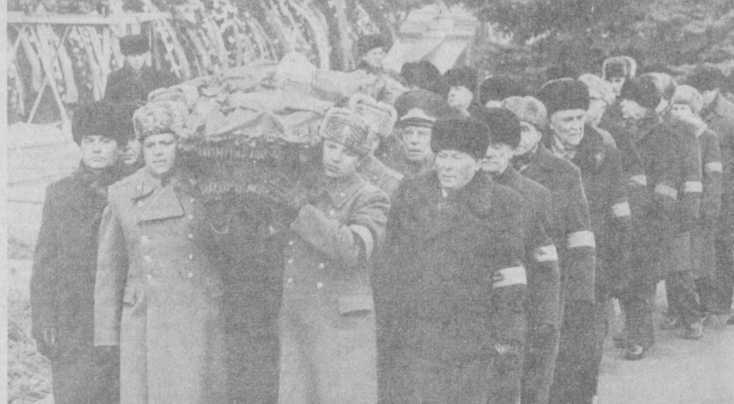
Во время похорон Ю. В. Андропова.