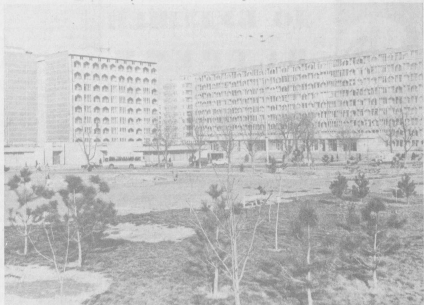
В Ташкенте стало 2 миллиона жителей! Этот факт в истории города — важная веха. В Советском Союзе эту веху прошли лишь три города — Москва, Ленинград, Киев.

Сегодня Ташкент — крупный промышленный и культурный центр. Здесь проживало 200 тысяч человек (сейчас в 10 раз больше), то в 1926 году — 324 тыс., в 1939 г. — 585 тыс., в 1959 г. — 927 тыс. человек. В начале 1960 года Ташкент уже переходил в категорию так называемых «городов-миллионеров» с числом жителей более миллиона человек.