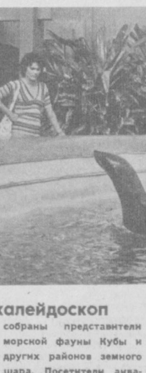
Куба. Национальный аквариум — одна из достопримечательностей кубинской столицы (на снимке). В нем обитают знакомые с жид-