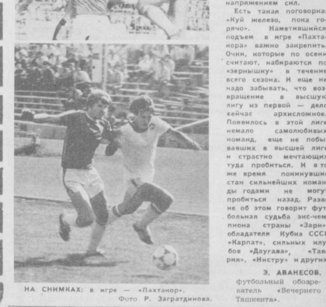
НА СНИМКАХ: в игре — «Пахтанор».

З. АВАНЕСОВ, футбольный обозреватель «Вечернего Ташкента».