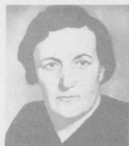
Людмила РУДЕНКО — вторая чемпионка мира, владевшая этим званием с 1950 по 1953 годы.