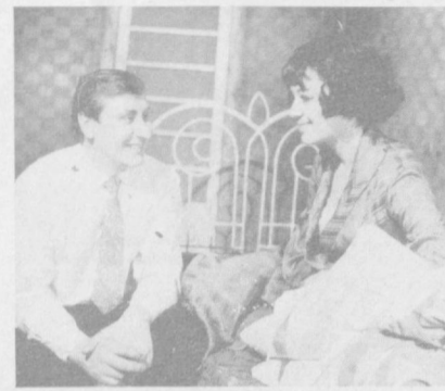
крупных городах проходили гастроли нашего театра. И вот завтра — первая встреча с ташкентскими зрителями. Свои выступления в Ташкенте коллектив театра пос-

вящает 60-летие образования Узбекской ССР и Компартии Узбекистана.