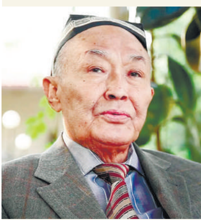
Абдулла ОРИПОВ, Ўзбекистон халқ шоири