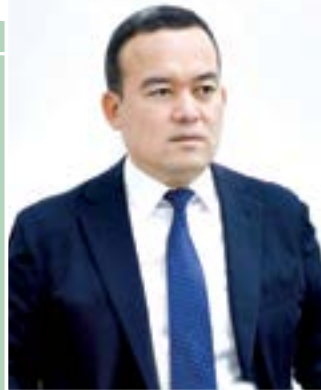
Ulug'bek QOSIMOV, Surxondaryo viloyati hokimi, senator