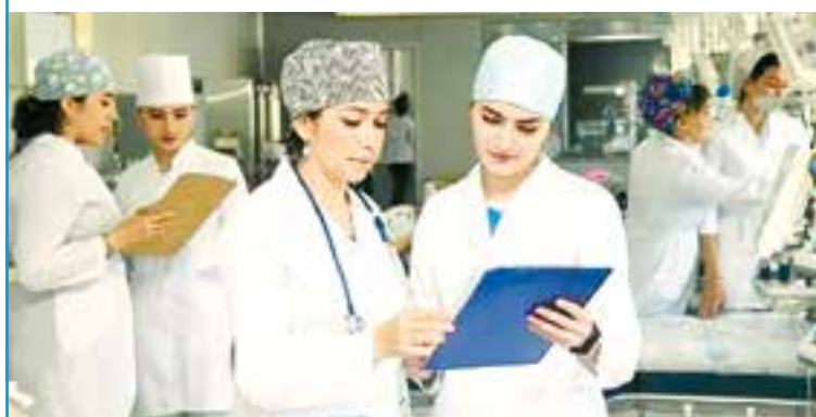
Sahifani Yoqubjon MARQAYEV tayyorladi.

Ijtimoiy himoyaga muhtoj shaxslarga ko'rsatiladigan bepul tibbiy xizmatlarning turlari va hajmi tibbiy faoliyatni amalga oshirish uchun berilgan litsenziyada ko'rsatilgan ixtisosliklar doirasida tashxis so'yish va davolash imkoniyatlaridan kelib chiqqan holda xususiy tibbiyot muassasalar tomonidan mustaqil ravishda belgilanadi.