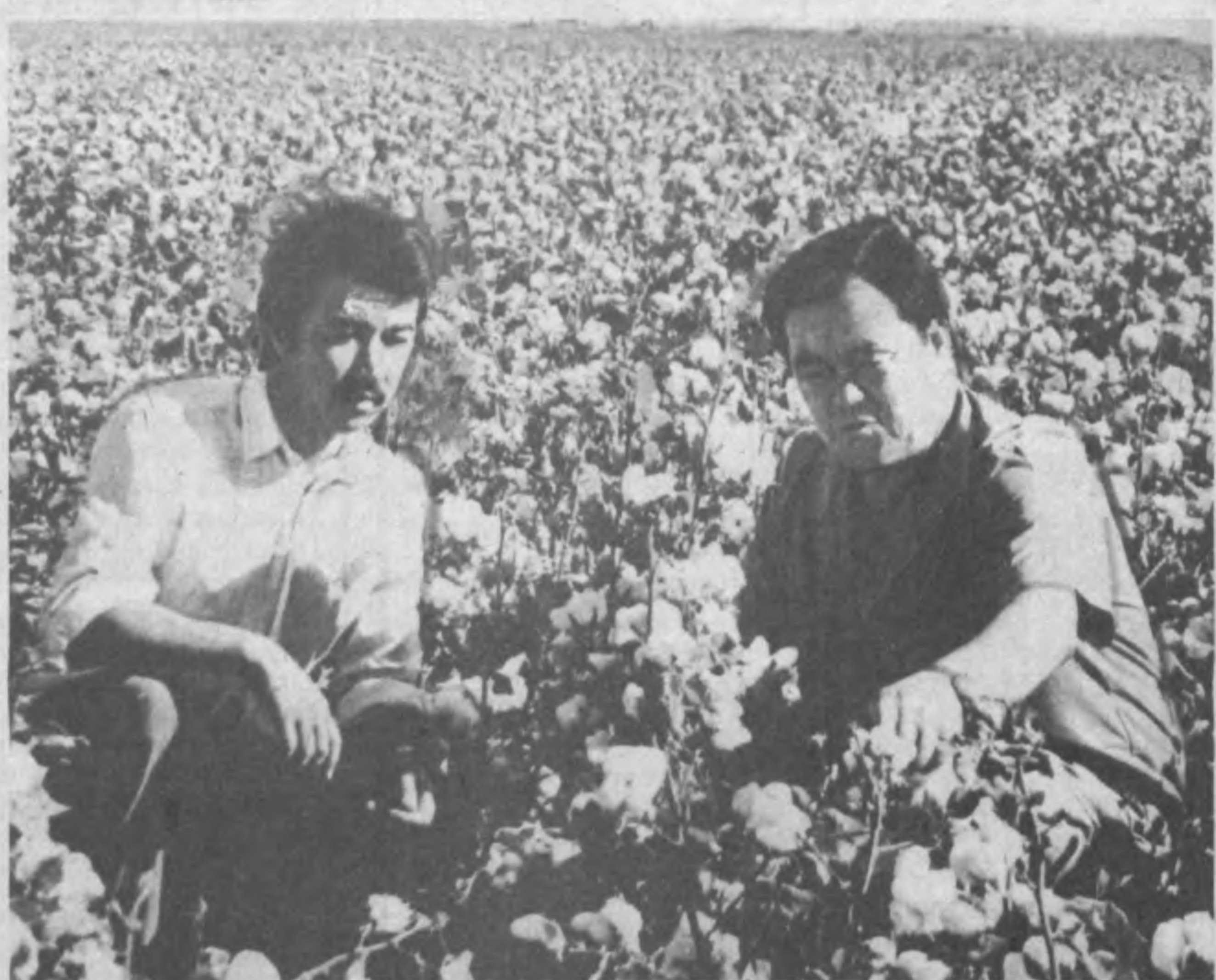
Меҳнатобод тумани пахтакорлари бу йил 16 миң гектар ерда «оқ олтин» етиштиришлар. Туман деҳқонлари маъжуд пахта майдонларининг ҳар гектаридан режадаги 19 ўрнига 25 центнердан ҳосил йиғиб-териб олиш мақсадида