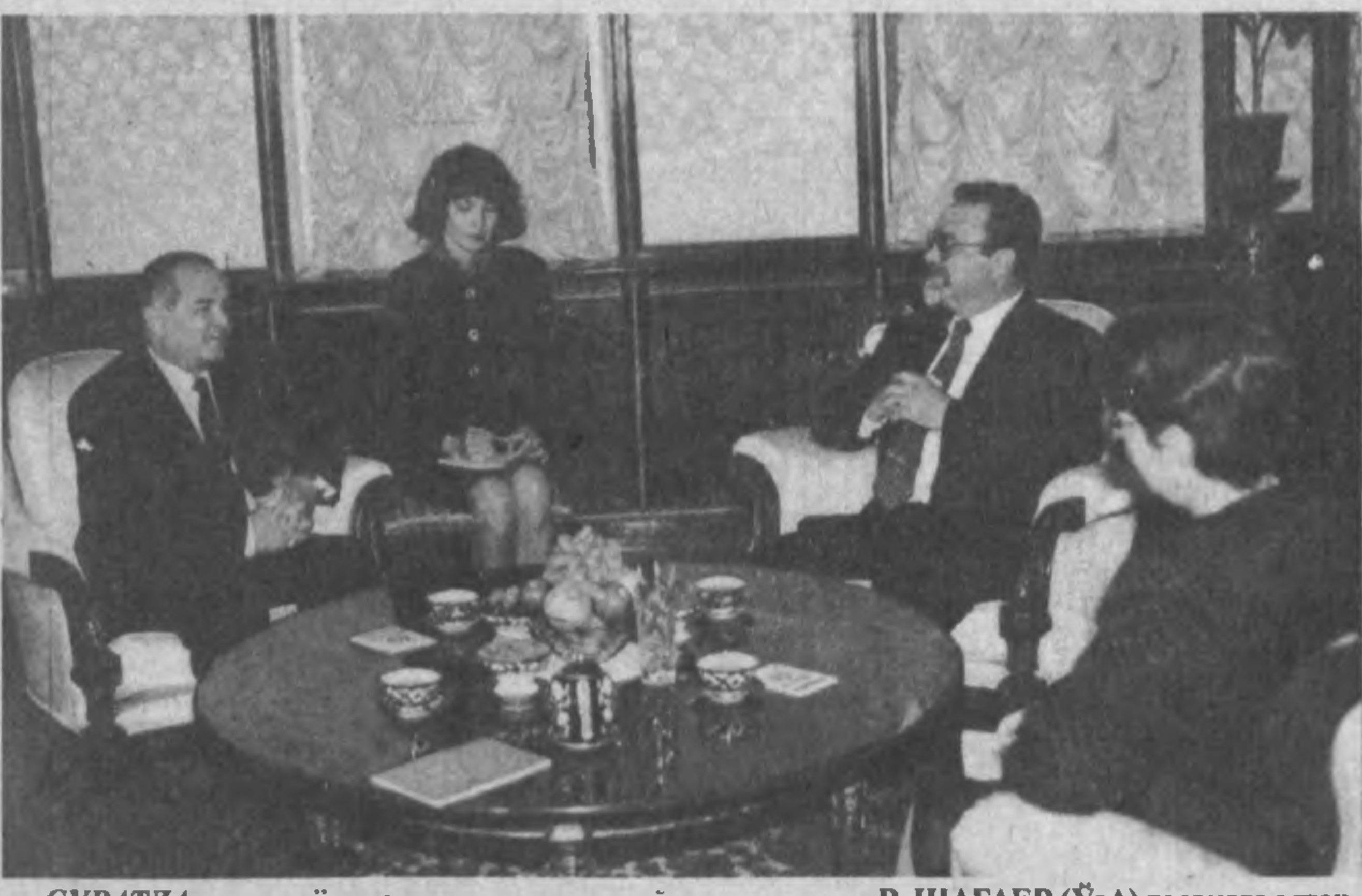
СУРАТДА: ишонч ёрлиғини топшириш пайти.

12 октябрь куни Ўзбекистон Республикаси Президенти Ислам Каримовга Америка Қўшма Штатларининг мамлакатимиздаги Фавкуллда ва Мухтор элчиси этиб тайинланган Стенли Туэмлер Эскудеро ишонч ёрлиғини топширди.