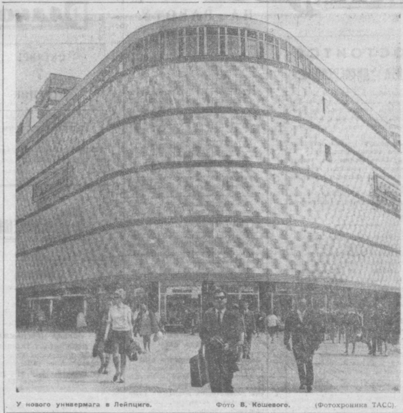
У нового универмага в Лейпциге.