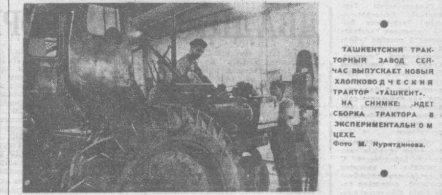
ТАШКЕНТСКИЙ ТРАКТОРНЫЙ ЗАВОД СЕЙЧАС ВЫПУСКАЕТ НОВЫЙ ХЛОПКОВОД Ч.С. И Я ТРАКТОР «ТАШКЕНТ». НА СНИМКЕ: ИДЕТ СБОРКА ТРАКТОРА В ЭКСПЕРИМЕНТАЛЬНОМ ЦЕХЕ.

А. НУГМАНОВ, завучемский организаторским отделом горисполкома.