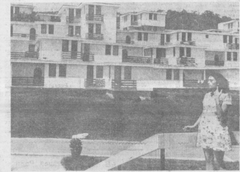
«Русалия» — уникальный по замыслу и исполнению курортный комплекс, расположенный в Таун-Кхамбане (Залив Пичи), одном из живописных мест болгарского Черноморского побережья.

Отмечается, что Ш. А. Данге «был всегда верен марксистско-ленинскому и принципам пролетарского интернационализма».