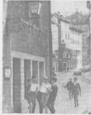
В. И. Ленин неоднократно бывал в Цюрихе, где выступал на собраниях и совещаниях русских социал-демократов.