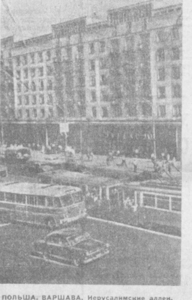
ПОЛЬША. ВАРШАВА. Иерусалимские аллеи.