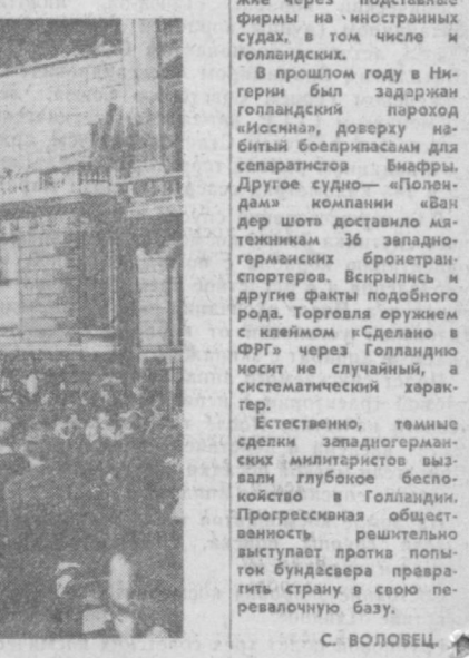
НА СНИМКЕ: дом № 144 на Пикадилли.