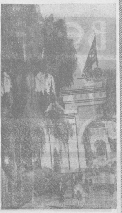
КНДР. НА СНИМКЕ: МУЗЕЙ В ПСКОЕ.