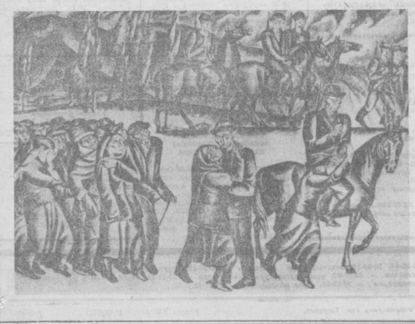
Л. ДАВАЗ. «ПАМЯТЬ О ПРОШЛОМ». (ПО МОТИВАМ ПРОИЗВЕДЕНИЯ Ч. АЙМАТОВА). «НА ФРОНТ» (ВНИЗУ).