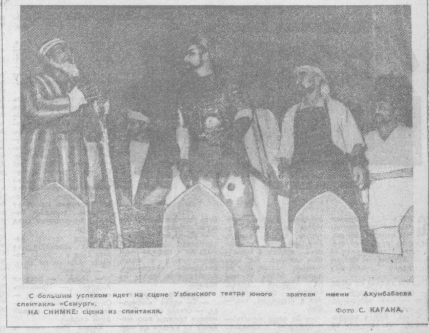
С большим успехом идет на сцене Узбекского театра юного зрителя имени Ахунбабава спектакль «Семерг». НА СНИМКЕ: сцена из спектакля.