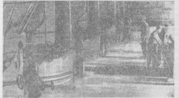
ГДР Сахарный завод в Гестрове — одно из многочисленных новых предприятий пищевой промышленности республики. НА СНИМКЕ: в аппаратном зале завода.