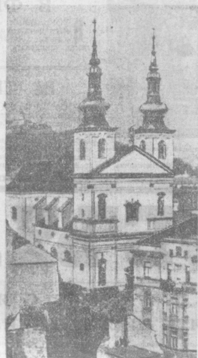
ЧЕХОСЛОВАКИЯ. БРНО. Старинный барочный доминиканский храм.