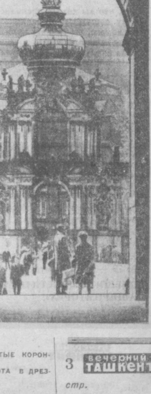
ГДР. ЗНАМЕНИТЫЕ КОРОНАЦИОННЫЕ ВОРОТА В ДРЕЗДЕНЕ.

шой коалиции» на роли младшего партнера не дала возможности социал-демократии что-либо изменить в этой области. В канун выборов уже можно было заметить попытки СДПГ создать свой самостоятельный образ, что, видимо, нашло отражение и в результатах голосования избирателей. В частности, выдвигались предложения более конструктивно подойти к вопросу о необходимости признания границ, к вопросу о нормализации отношений с ГДР, к идее общеевропейского совещания, более ясно заявить о необходимости подлинного Договора о нераспространении ядерного оружия. В свою очередь не остались незамеченными и различные оговорки, на которых скрывается влияние двусмысленности прежней политики. Например, высказывания за ликвидацию «доктрины Хальштейна» не подрываются логическим выводом о необходимости полного признания Германской Демократической Республики. В вопросе о границах то и дело возникают оговорки о «временном характере признания» и т. д.