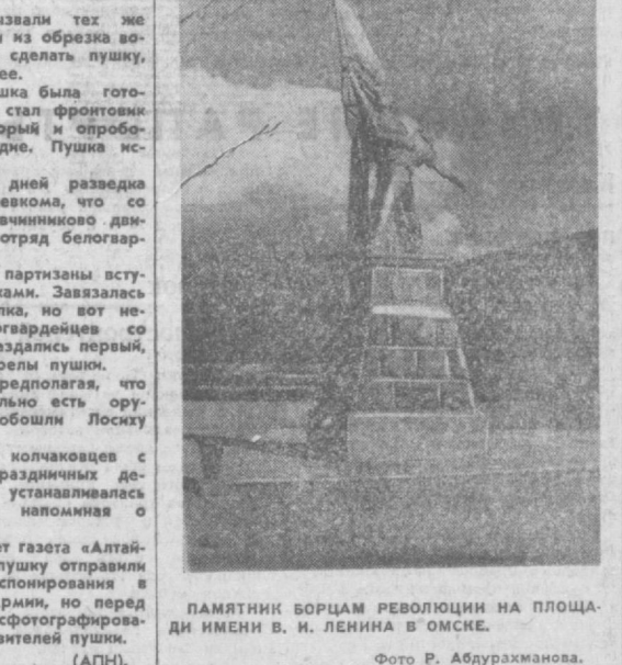
ПАМЯТНИК БОРЦАМ РЕВОЛЮЦИИ НА ПЛОЩАДИ ИМЕНИ В. И. ЛЕНИНА В ОМСКЕ.