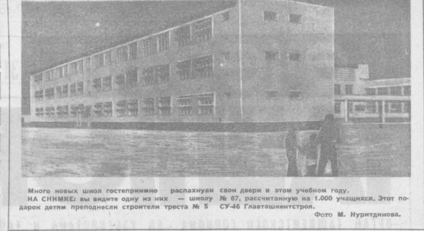
Много новых школ гостеприимно распахнут свои двери в этом учебном году. НА СНИМКЕ: вы видите одну из них — школу № 67, рассчитанную на 1.000 учащихся. Этот подарок детям преподнесли строители треста № 5 СУ-46 Главташкентстроя.